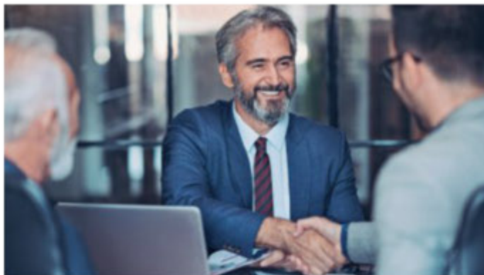
PASSI IN AVANTI PER UNA MIGLIOR GESTIONE DELLE RISORSE

pubblici uffici, con attenzione a capacità e attitudini e limitazione degli esterni, nominati spesso dal politico di turno. Un'opera importante e ambiziosa, ma che non si ferma ai comodi del contratto collettivo. FEDIRETS infatti, nelle sue varie componenti, sarà NON SOLO presente ai tavoli delle amministrazioni nella fase della contrattazione integrativa, cercando di tutelare gli interessi degli iscritti tramite la corretta applicazione decentrata del CCNL, ma sarà presente altresì per trovare una giusta soluzione all'amministrazione difensiva, tema caro a Fedirets già da molti anni e che paralizza la firma della dirigenza soprattutto territoriale vista la inestricabilità della normazione centrale e periferica.